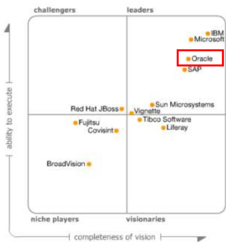
Figure 1. Magic Quadrant for Horizontal Portal Products

Gartner Magic Quadrant Horizontal Portal 분야 (2008년 하반기 발표) → 리더제품 선정